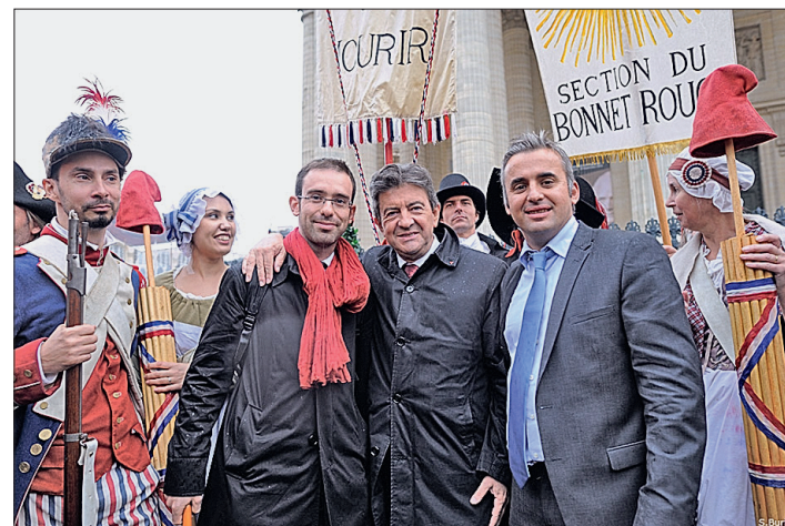
Жан-Люк Меланшон (в центре) с авторами книги.

ков. Выдающийся деятель французской революции Максимилиан Робеспьер привлекал к себе особое внимание. Одни видели в нём жестокого тирана и связывали с его именем только террор эпохи якобинской диктатуры, другие отмечали его исключительную роль в утверждении «республиканских ценностей» во Франции после уничтожении «старого режима», то есть монархии. Сегодня его имя вновь в центре политической борьбы.